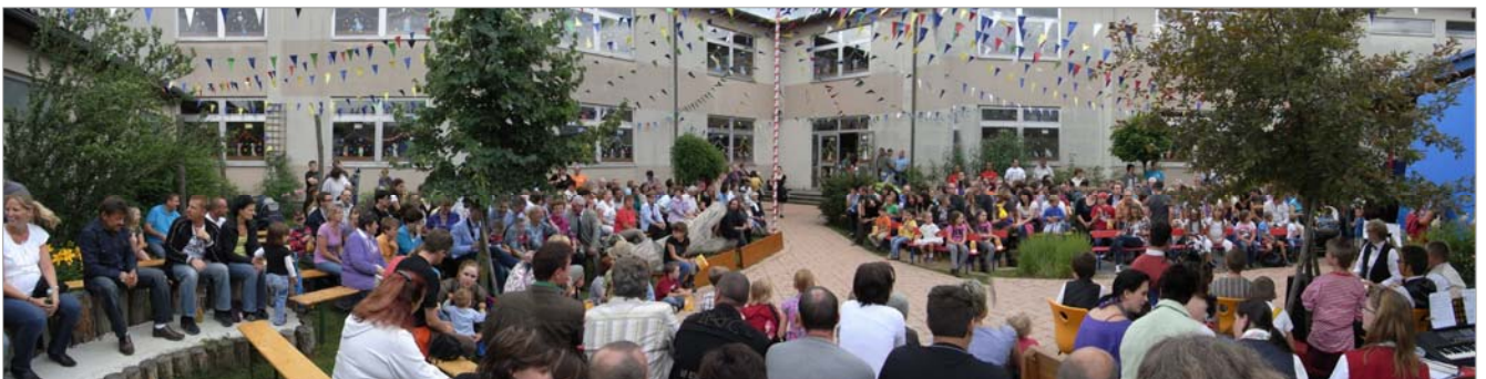
die bis zum letzten Platz ausverkaufte Zirkusarena

Wir wünschen den beiden Direktoren alles Gute für den neuen Lebensabschnitt!