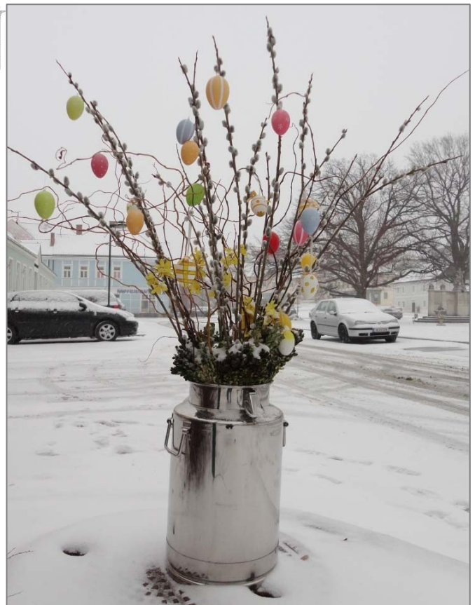
Hauptplatz Sitzendorf, aufgenommen am 25.03.2013

wünschen Ihnen der Bürgermeister, die Gemeinderäte und Ortsvorsteher sowie die Gemeindebediensteten der Marktgemeinde Sitzendorf an der Schmida