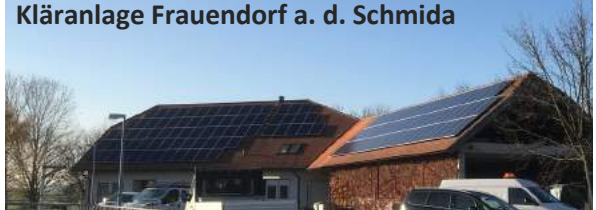
Kläranlage Frauendorf a. d. Schmida